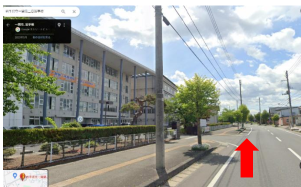
① 一関第二高校正門前を通り過ぎます