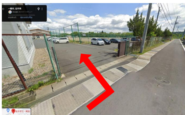
③ グラウンドの手前にフェンシング場へ続く入口があります。